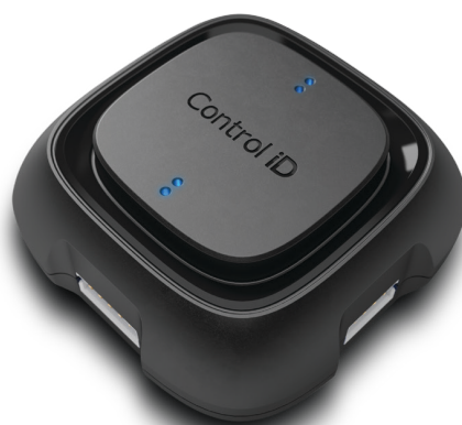
( Módulo de Acionamento )