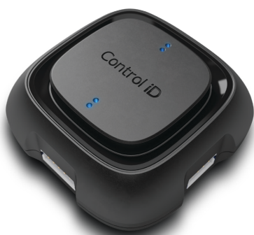
(Módulo de Acionamento)